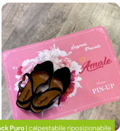
Tack Puro | calpestabile riposizionabile